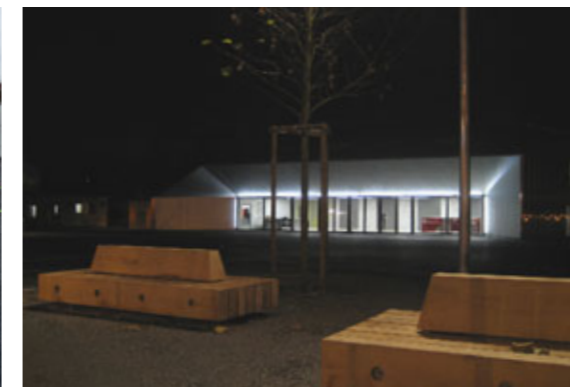
Ansicht Parkseite - Grosses Aussichtsfenster zum Parkraum im Herbst Vorplatz mit Bemalung (Kunst am Bau), die sich im Foyer fortsetzt - Vorplatz mit Sitzgelegenheiten bei Nacht, während einer Veranstaltung