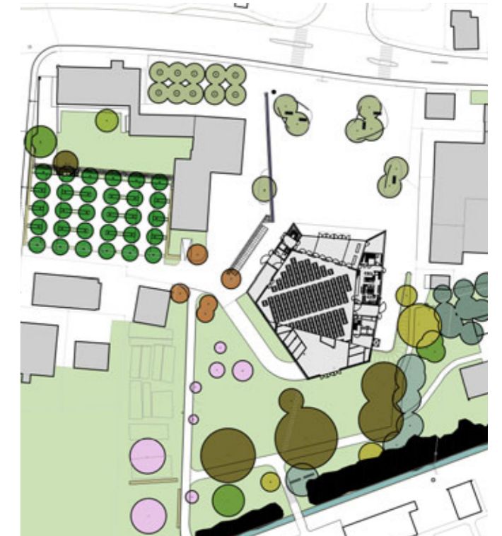
Situationsplan mit Bepflanzung