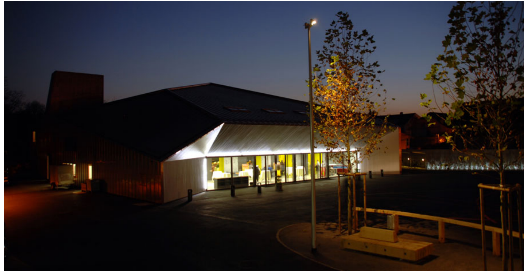
Eine der drei möblierten Inseln auf dem Vorplatz mit Blick aufs Foyer

Der grosszügige und flexibel nutzbare Vorplatz ist das Bindeglied zwischen Pentorama und dem Stadtzentrum von Amriswil. Er bereitet die Besucher insbesondere bei abendlichen Veranstaltungen auf das festlich erleuchtete Innere des Saals vor. Er zeichnet sich aus durch eine einfache und robuste Ausstattung: Die möblierten, punktiert beleuchteten Kiesinseln mit Platanen bieten Treffpunkte am Rand des sonst dunklen Platzes an. Ein dezentes Lichtspiel belebt die skulptural ausformulierte Brüstungsmauer. Massive Bänke und Anbindebalken aus Eiche bieten Halt und Orientierung auf der offenen Fläche. Die Platanen als grosswachsende Stadtbäume werden diesen Ort mit dem Alter immer deutlicher prägen.