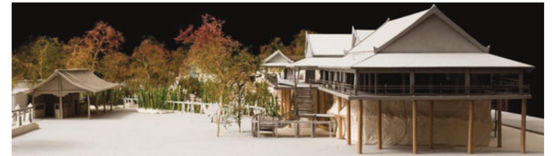
Gehege und Logde