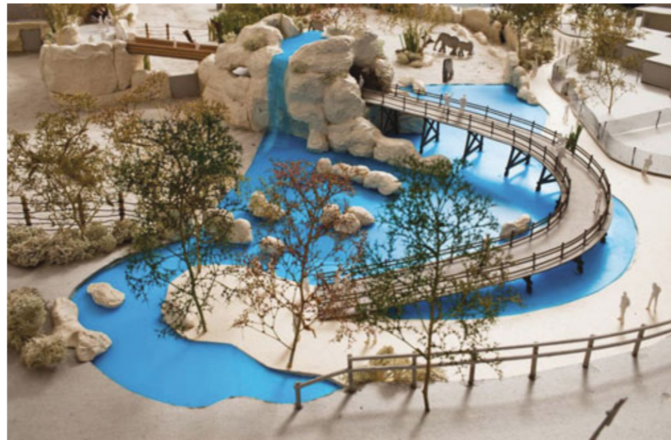
Höhenweg und Wasserlandschaft im Modell