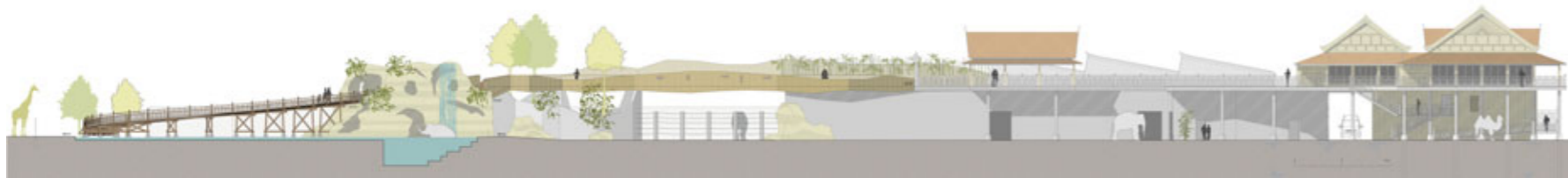
Ansicht des Höhenweges

Knie's Kinderzoo wird um die Fläche eines Fussballfeldes vergrössert. Darauf wird eine neue, zeitgemässe Elefantenanlage mit Bullenhaltung sowie ein Restaurantbetrieb für Zoogäste sowie externe Gäste entstehen. Die besonderen gestalterischen Merkmale dieser Anlage sind zum einen der Höhenweg für die Besucher, welcher sich über die grosszügige Wasserlandschaft für die Elefanten erhebt und auf 6m Höhe in das neue Restaurant führt, zum anderen das parkgleiche Wegenetz und seine Bepflanzung, welche den Besucher führen, die Blicke lenken und an den zentralen Stellen besondere Atmosphären schafft.